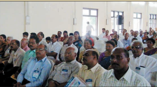
വേനൽശിബിരം 2015 പ്രസക്ത ഭാഗങ്ങൾ